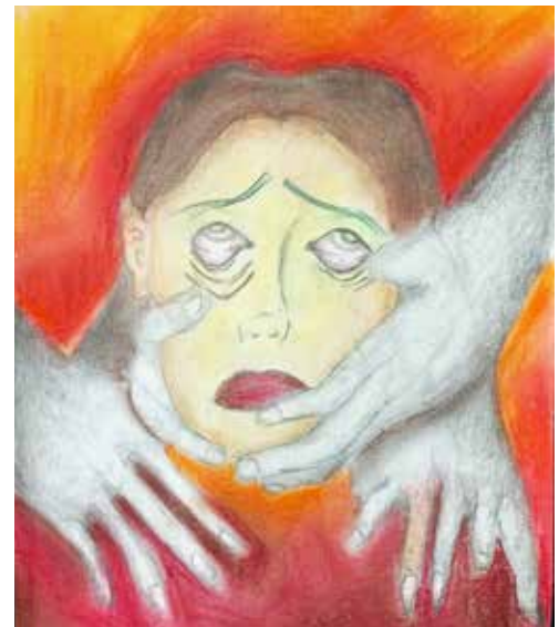
Έργα μαθητών μας του προσανατολισμού καλών τεχνών